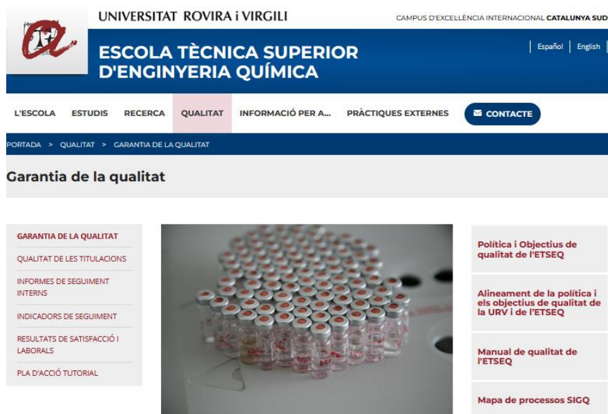
Figura 2. Plana web principal de Qualitat de l'ETSEQ – gener 2023